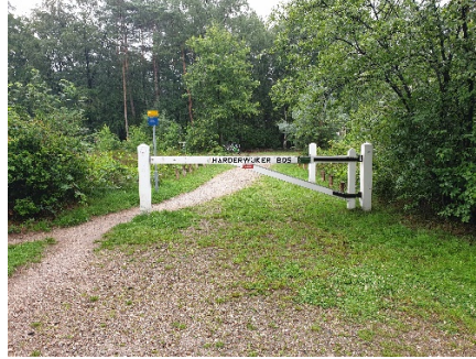
Het begin- en eindpunt